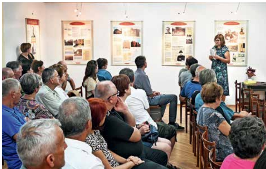
Razstava o premalo znanih rojakih je pritegnila številne Žirovce.