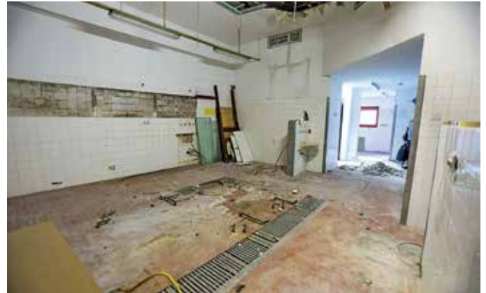
Prenovo nekdanje šolske kuhinje so zamaknili v prihodnje leto.

Med večjimi naložbami v prihodnjem letu je župan poudaril ureditev fitnesa na prostem in nadaljnje urejanje celotnega območja Športno-rekreacijskega parka Pustotnik. V prihodnje leto so zamaknili projekt prenove nekdanje šolske kuhinje v prostore vrtca, ki bi se morala začeti med jesenskimi počitnicami, a se je še pred začetkom del izkazalo, da bo treba najprej izdelati požarni red za celotno šolo. V proračunu so zagotovili tudi denar za obnovo komunalne opreme in cest v Dobračevski in Prvomajski ulici ter na odseku Čevljarske ulice in ceste Pod griči. Sredstva so namenili še za komunalno opremljanje območja ob Jezernici.