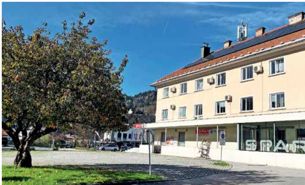
Urejanje središča Žirov bo potekalo v več fazah.

Prvi sklop urejanja središča Žirov namreč predvideva sonaravno ureditev območja vodotoka Račeva in izvedbo protipoplavnih ukrepov ter gradnjo novih parkirišč. Na predvidene vodnogospodarske ureditve Račeve pa je po besedah župana Francija Kranjca Zavod za ribištvo Slovenije podal negativno mnenje, kar bi lahko ogrozilo začetek izvajanja projekta, s tem pa tudi pridobitev 1,1 milijona evrov državnih in evropskih sredstev. Zato so se po seji že sestali s predstavniki zavoda, sestanka so se udeležili tudi žirovski ribiči. Za zdaj jim je uspelo razrešiti glavne