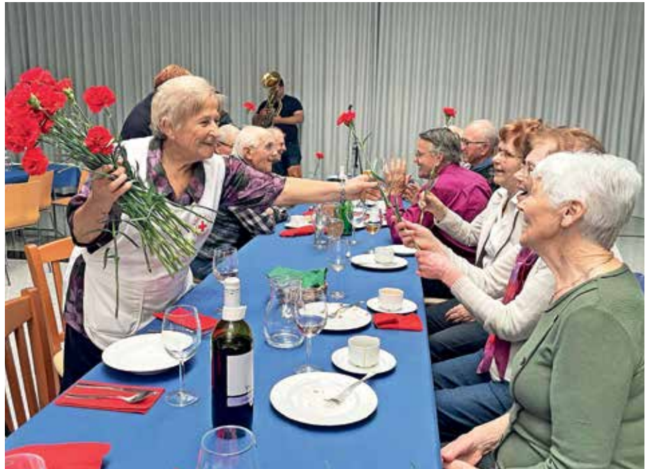
Starejše občane so razveselili z nageljni.

Jesen življenja prinaša mnoge radosti. Leta pa so le številka. Lepo je, kadar se znamo tudi medgeneracijsko družiti in povezovati.