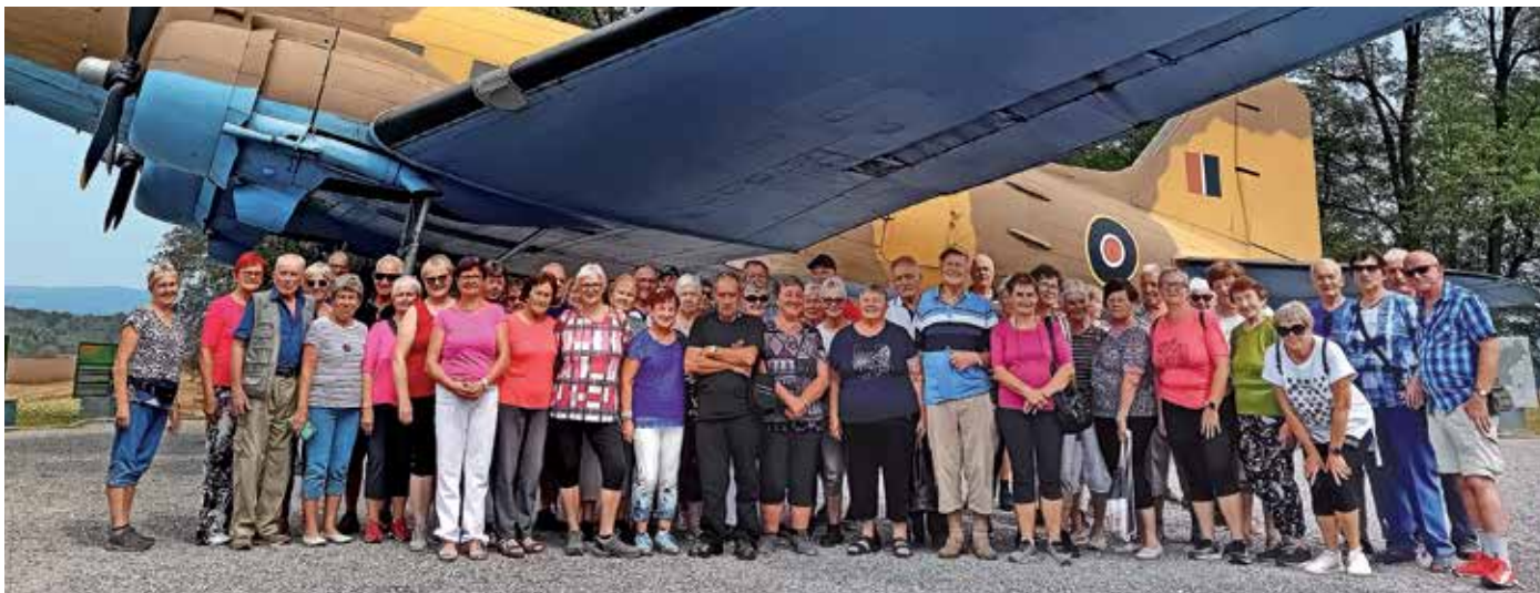
Člani društva ob letalu Dakota DC3 na izletu v Beli Krajini

Pristopno izjavo je mogoče izpolniti v času uradnih ur, to je vsako sredo med 9. in 11. uro v društveni pisarni na Jobstovi cesti 9.