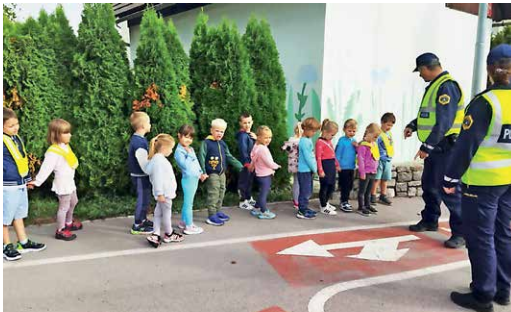
Najmlajši so v družbi policistov spoznavali varne poti.

Mesec oktober pa je bil tokrat v znamenju tedna otroka, požarne varnosti in jeseni. Najmlajši v jasličnih oddelkih so si v tednu otroka ogledali glasbeno predstavo Razbita buča, ki so jim jo pripravile vzgojiteljice, se odpravili na Ledinico, kjer so