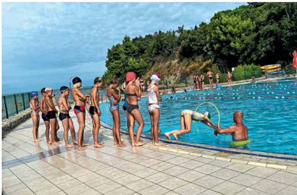
Plavalna šola na Debelem rtiču

Učenci petih razredov so preživeli pet uspešnih dni v plavalni šoli na Debelem rtiču ob učenju in izpopolnjevanju plavanja.