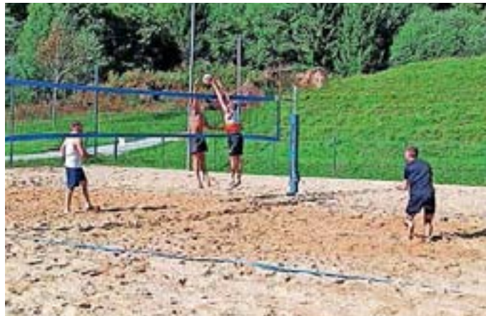
Dan slovenskega športa na Pustotniku je bil dobro obiskan.