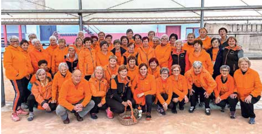
Skupinsko praznovanje prvega leta vadbe 1000 gibov v Žireh

Vadba 1000 gibov, ki poteka v okviru Društva Šola zdravja, je v Žireh zelo priljubljena, saj jo obiskuje približno 80 aktivnih članov, ki v treh skupinah vadijo na treh različnih lokacijah – vsak dan od ponedeljka do petka se ob 8. uri zberejo pod skakalnico v Novi vasi, kjer vadbo vodi Milan Zajc, vadbi ob 8. uri na igrišču na Jezerih in ob 9. uri pred Gasilskim domom v Račevi pa vodi Irena Reč-