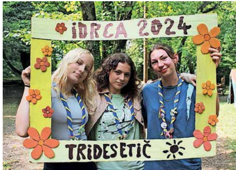
Tabor ob reki Idrijci smo letos postavili že tridesetič.

popotnice in en popotnik – pa se je udeležilo mednarodnega tabora Roverway, ki ga je tokrat gostila Norveška. Na pot so se odpravili kar s kombijem, na poti do tabora pa so si ogledali Bremen v Nemčiji, Odense in København na Danskem, Vessigebro, Göteborg in Oslo na Švedskem, sedmi dan pa so prispeli na Norveško v mesto Lillehammer. Do glavnega tabora, kjer so preživeli teden dni, so prispeli na enajsti dan. V istem času smo se štirje raziskovalci in raziskovalke odpravili na izlet v drugo smer. Obiskali smo Sarajevo, potem pa prečkali mejo v Črno goro. Peljali smo se po kanjonu reke Pive ob 45 kilometrov dolgem zajezenem jezeru. Prespali smo v narodnem parku Durmitor, potem pa smo nekaj dni preživeli na obali v mestu Bar. Vrnili smo se po hrvaški obali ter si spotoma ogledali Dubrovnik in Zadar. Konec avgusta smo v Žireh na našem Otočku teden dni gostili tabornike iz Francije. Iz mesta Beauvais nas je sredi avgusta