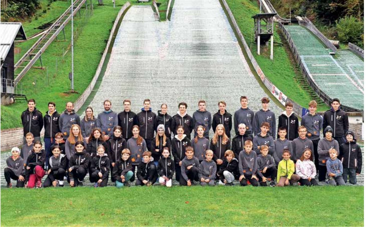
Tekmovalci in trenerji SSK Norica Žiri