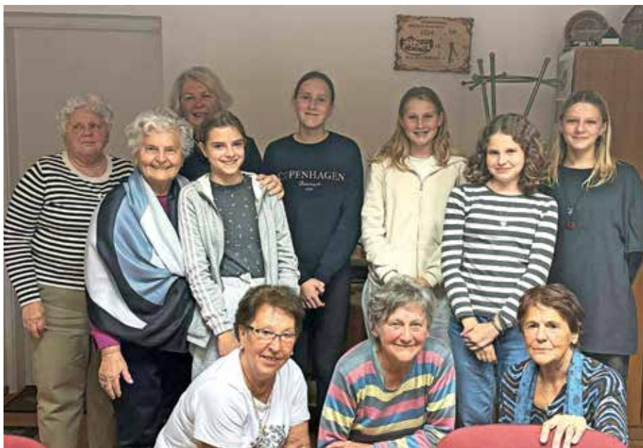
Mlade prostovoljke na obisku pri Žirovskih vrticah

Številni dnevi dejavnosti tako kulturnih, naravoslovnih kot tehničnih vsebin so bili izpeljani po načrtu ter prilagojeni vremenskim razmeram. Potekajo že tudi številna šolska tekmovanja na različnih področjih, npr. razni natečaji, ki se jih učenci žirovske osnovne šole pridno udeležujejo.