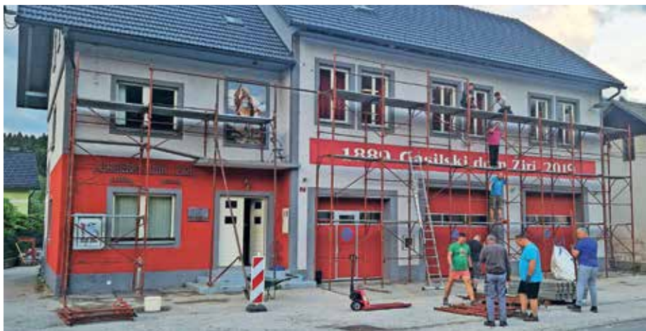
Prenova strehe gasilskega doma

Poleg vseh že naštetih dejavnosti letno pripravimo še nekaj prireditev, s katerimi zbiramo dodatna sredstva za delovanje društva. Ob koncu šolskega leta že tradicionalno skrbimo za organizacijo Žirovske noči z bogatim srečelovom, ob koncu počitnic pa za zabavo poskrbimo s prireditvijo Žirfest, s katero se poslovimo od poletja in pozdravimo novo šolsko leto in jesen, ki je pred vrati. Za slovo od koledarskega leta tudi letos pripravljamo prednovoletno rajanje s potopisnim predavanjem in živo glasbo, lepo vabljeni, da se nam pridružite 27. in 28. decembra v središču Žirov.