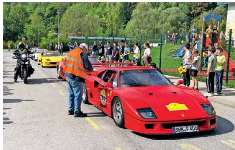
Povorka starodobnih ferrarijev se je ustavila tudi v Žireh.

Dogodek vsako leto organizirajo na izbranih lokacijah in letos jih je pot popeljala tudi skozi Žiri. Letos je bil namreč Ferrari Cavalcade Classiche posvečen Furlaniji - Julijski krajini in Sloveniji. Zato so se z jeklenimi lepotci zapeljali tudi po gorenjskih cestah od Žirov do Kranja in Medvod ter se nato skozi Ljubljano in Polhov Gradec mimo Lučin vrnili do Gorenje vasi ter se nato skozi Cerkljo odpeljali proti Primorski.