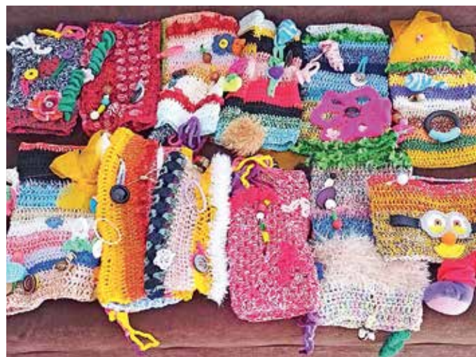
Rokavčki pomagalčki za osebe z demenco

»Odeje so namenoma dolge in široke en meter, tako da si lahko gibalno ovirani v invalidskih vozičkih brez težav pokrijejo noge, da jih ne zebe, obenem pa se ne zapletajo v kolesa in vlečejo po tleh,« je razložila Nevenka Stegel in dodala, da so odeje izdelane