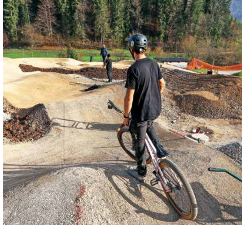
Na Pustotniku urejajo kolesarski poligon.

Grbinasti poligon so zasnovali na način, da se v največji meri prilagodi obliki razpoložljive površine. »Poligon poleg zavojev sestavljajo grbine različnih višin, kar omogoča atraktivno izkušnjo tudi za bolj izkušene uporabnike, obenem pa to ne preprečuje uporabe manj izkušenim,« so pojasnili na občini in dodali, da je poligon sestavljen iz zaobljenih grbin in zavojev, ki so med seboj ritmično povezani v krožno celoto. »Razgibanost poligona omogoča pestro in zabavno, a varno kolesarsko vožnjo.« V sklopu gradnje športnih objektov nameravajo zgraditi tudi dostopno pot iz smeri parkirišč ter postaviti urbano opremo, kot so klopi, javna razsvetljava in koši za ločevanje odpadkov, na koncu pa je predvidena še zasaditev dodatnih dreves na tem območju, so napovedali na občini.