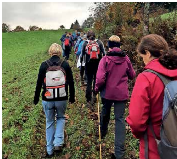
Letošnjega pohoda se je udeležilo 52 pohodnikov, pridružil se jim je še šest kolesarjev.

Smer letošnjega pohoda je bila Žiri–Goropeke–Opale–Smrečje–Lavrovec–Goli vrh–Nova vas (Nordijski center). Ob 8. uri se je iz središča Žirov v smeri Goropek podalo 52 pohodnikov in dve uri kasneje še šest kolesarjev. Megleno jutro so kmalu zamenjali sončni žarki in naredil se je prekrasen dan. Udeleženci smo uživali v hoji, razgledovanju, klepetu in druženju. Skoraj nismo opazili, da je bilo za nami malodane dvajset kilometrov poti. In klancev za več kot osemsto metrov. In da, po vsem tam veselju tudi želodčki niso ostali prazni. Se vidimo ponovno prihodnje leto!