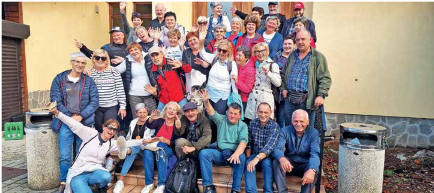
Generacija 1961 na izletu v neznano ob reki Krki v Novem mestu

Generacija 1961, ki je v osnovno šolo vstopila leta 1968, končala pa jo je leta 1976, je ena izmed številnejših. V treh prvih razredih sem na fotografijah našela 87, na valeti pa 85 učencev.