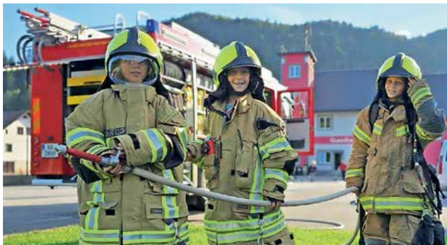
Aktivnosti z mladino

Ker želimo, da društvo in njegova primarna dejavnost, zaščita in reševanje pri požarih in nesrečah, delujeta kot dobro utečen stroj, veliko dela, časa, usklajevanja, izobraževanja in volje posvetimo tudi temu. Da v operativni enoti, ki trenutno