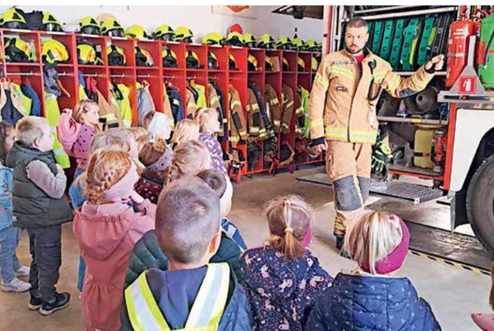
V oktobru, mesecu požarne varnosti, so obiskali gasilce PGD Dobračeva.

Najbolj živahno pa je bilo tokrat pri Pohajalčkih, Hihitalčkih in Skakalčkih, ki si bodo letošnjo jesen zapomnili po delu na vrtu in domačih dobrotah, saj so z vzgojiteljicami na vrtčevskem vrtičku najprej pobrali pridelke in ga pripravili na zimo, nato pa so se odpravili še na obisk Zeljane Lojz na Fužinah, kjer so preživeli poučno dopoldne, izvedeli, kako se kisa zelje, in ga z veseljem tudi pokusili. S predstavniki Centra za arhitekturo so v okviru delavnice Igrive arhitekture spoznavali lepoto lesa in njegovo uporabo, ob obisku PGD Dobračeva so se z gasilci pogovarjali o požarni varnosti in njihovem delu, s policisti PP Škofja Loka pa so se odpravili še na poučen sprehod po Žireh, na katerem so spoznali varne poti in cestnoprometna pravila. Z navdušenjem so prisluhnili uri pravljic v žirovski knjižnici in predstavitvi glasbil, ki so jim jo pripravili v Glasbeni šoli Škofja Loka, se v okviru filmske vzgoje odpravili na ogled risanege filma Zverinice iz gozda Hokipoki in se za piko na i odpeljali še v Ljubljano na ogled baletne predstave Mali princ.