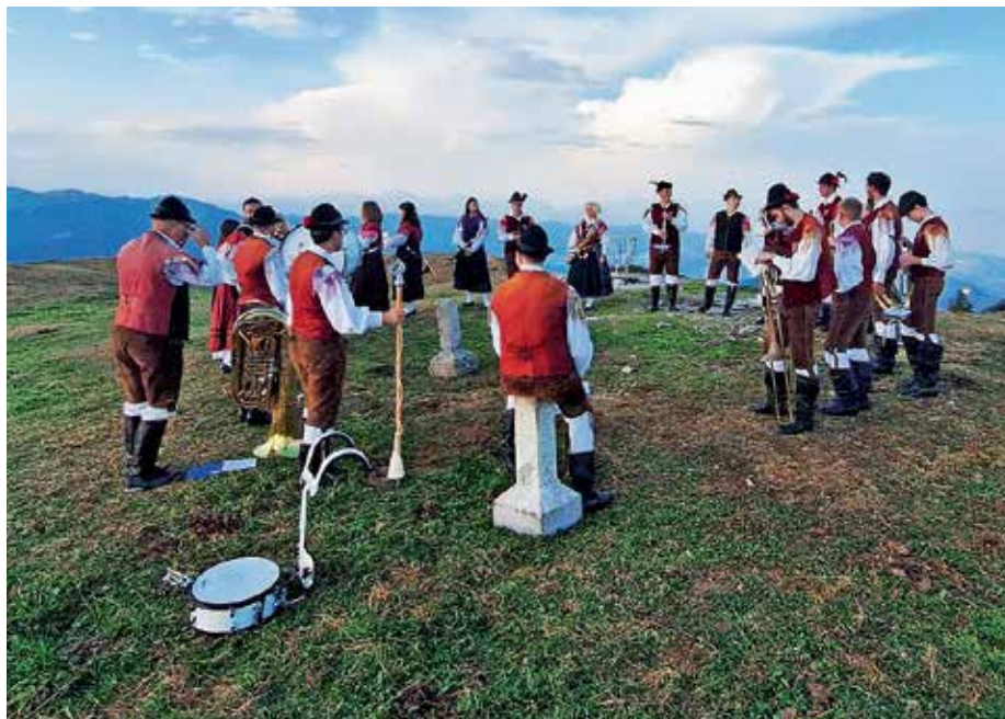
Pihalni orkester Alpina Žiri

Na dogodku ob prižigu lučk bomo imeli na voljo tudi že vstopnice za naš tradicionalni božično-novoletni koncert, na katerega