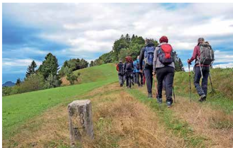
Turistično društvo Žiri je tudi letos pripravilo tradicionalni pohod ob nekdanji rapalski meji.